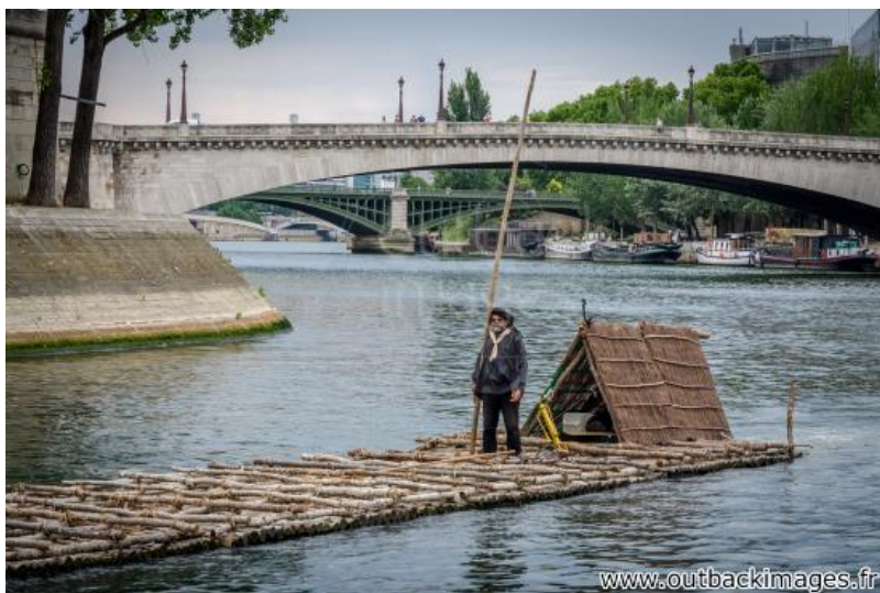
Les flotteurs de bois morvandiaux. Reconstitution Juin-Juillet 2015. Traversée de Paris le 5 juillet