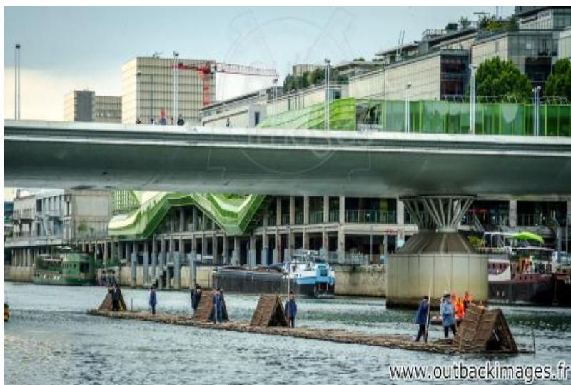
Les flotteurs de bois morvandiaux. Reconstitution Juin-Juillet 2015. Traversée de Paris le 5 juillet, départ du quai de Bercy