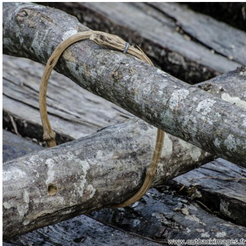
Les joutes des flotteurs de bois de Clamecy, Nièvre. Détails des liens faits avec des branches de charme *** Local Caption *** Clamecy est surnommée la cité des flotteurs de bois, pratique qui consistait, au 16e siècle, à flotter le bois de chauffage du Nivernais à Par