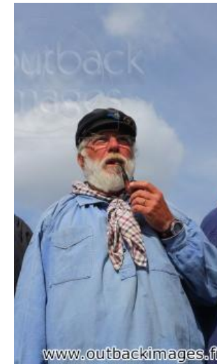
Les flotteurs de bois morvandiaux. Reconstitution Juin-Juillet 2015. Le train de bois sur la Seine près du port de Bercy. Portraits de morvandiaux flotteurs de bois