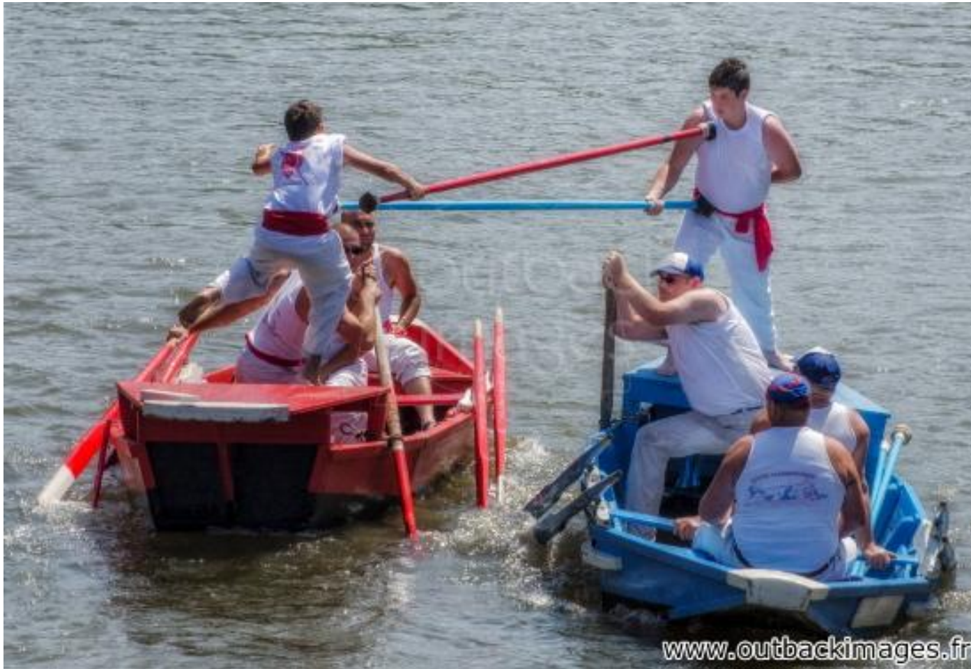
Les joutes des flotteurs de bois de Clamecy, Nièvre. Combat des jouteurs sur l'Yonne *** Local Caption *** Clamecy est surnommée la cité des flotteurs de bois, pratique qui consistait, au 16e siècle, à flotter le bois de chauffage du Nivernais à Paris, par l'Yonne et l