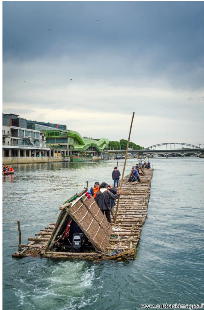
Les flotteurs de bois morvandiaux. Reconstitution Juin-Juillet 2015. Traversée de Paris le 5 juillet, départ du quai de Bercy