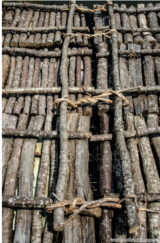
Les joutes des flotteurs de bois de Clamecy, Nièvre. Détails des liens faits avec des branches de charme *** Local Caption *** Clamecy est surnommée la cité des flotteurs de bois, pratique qui consistait, au 16e siècle, à flotter le bois de chauffage du Nivernais à Par