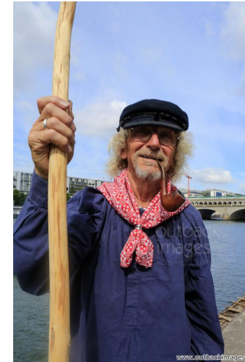
Les flotteurs de bois morvandiaux. Reconstitution Juillet 2015. Le train de bois sur la Seine près du port de Bercy. Portrait de morvandiau flotteur de bois