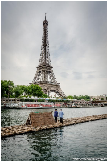
Les flotteurs de bois morvandiaux. Reconstitution Juin-Juillet 2015. Traversée de Paris le 5 juillet; le train de bois sur la Seine devant la Tour Eiffel