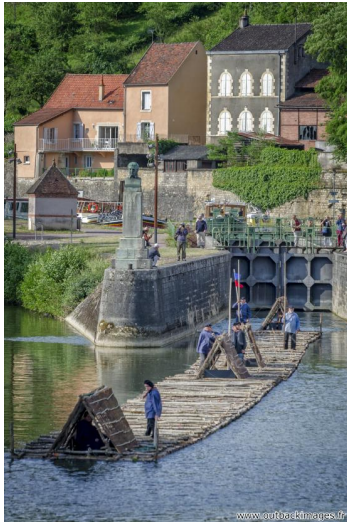
Les flotteurs de bois morvandiaux. Reconstitution Juin-Juillet 2015. Constitution d'un train de bois, Clamecy, Nièvre. Passage dans l'écluse près du perthuis, sortie