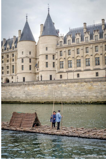
Les flotteurs de bois morvandiaux. Reconstitution Juin-Juillet 2015. Traversée de Paris le 5 juillet; le train de bois sur la Seine devant la Conciergerie