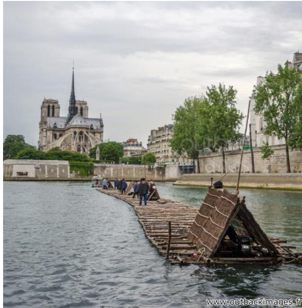
Les flotteurs de bois morvandiaux. Reconstitution Juin-Juillet 2015. Traversée de Paris le 5 juillet, le train de bois entre Ile St-Louis et Ile de la Cité