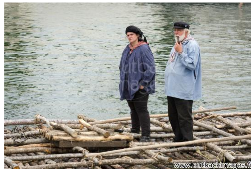
Les flotteurs de bois morvandiaux. Reconstitution Juin-Juillet 2015. Traversée de Paris le 5 juillet. Le train de bois sur la Seine près du port de Bercy; deux flotteurs