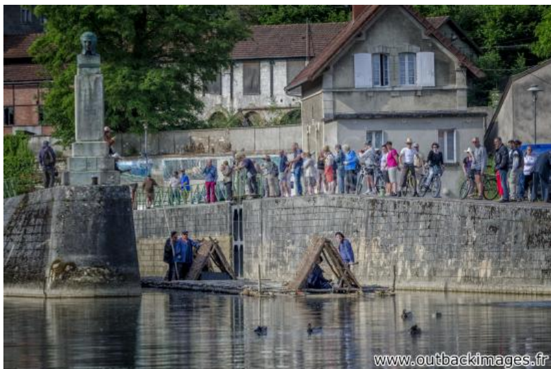
Les flotteurs de bois morvandiaux. Reconstitution Juin-Juillet 2015. Le train de bois dans l'écluse de Clamecy, Nièvre