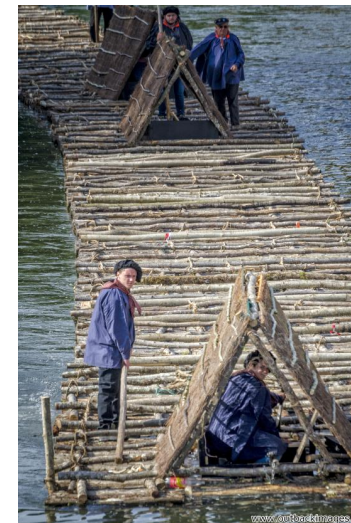
Les flotteurs de bois morvandiaux. Reconstitution Juin-Juillet 2015. Les conducteurs du train de bois