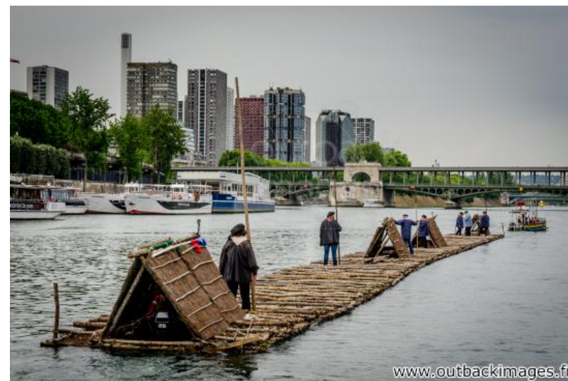
Les flotteurs de bois morvandiaux. Reconstitution Juin-Juillet 2015. Traversée de Paris le 5 juillet; le train de bois sur la Seine vers le pont de Bir Hakeim