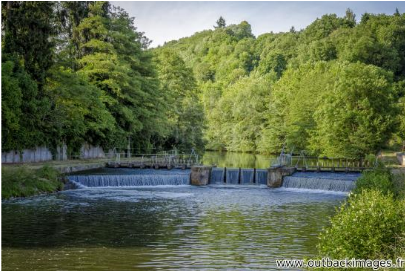
Les flotteurs de bois morvandiaux. Reconstitution Juin-Juillet 2015. Perthuis sur l'Yonne, Clamecy, Nièvre. Une écluse permet le passage du train de bois