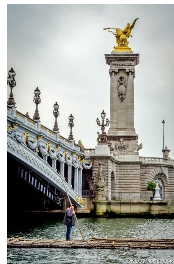
Les flotteurs de bois morvandiaux. Reconstitution Juin-Juillet 2015. Traversée de Paris le 5 juillet; le train de bois sur la Seine sous le pont Alexandre 3