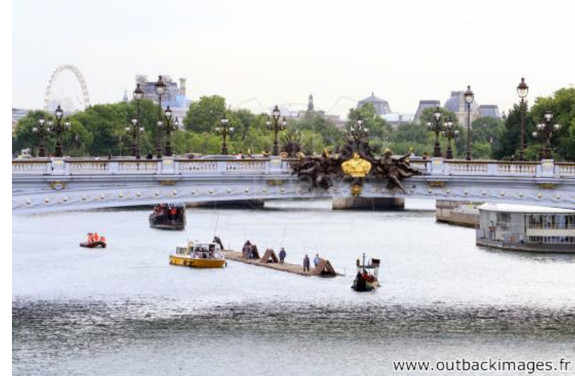
Les flotteurs de bois morvandiaux. Reconstitution Juin-Juillet 2015. Le train de bois sur la Seine dans Paris en route pour le port de Boulogne le 5 juillet