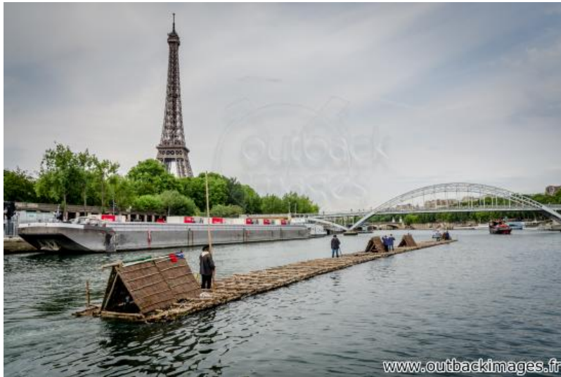
Les flotteurs de bois morvandiaux. Reconstitution Juin-Juillet 2015. Traversée de Paris le 5 juillet; le train de bois sur la Seine devant la Tour Eiffel