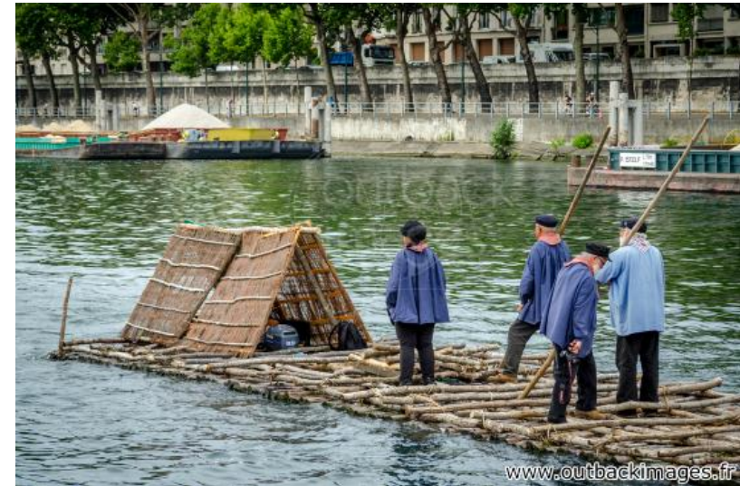
Les flotteurs de bois morvandiaux. Reconstitution Juin-Juillet 2015. Traversée de Paris le 5 juillet; le train de bois sur la Seine et ses flotteurs