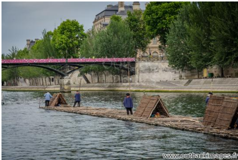
Les flotteurs de bois morvandiaux. Reconstitution Juin-Juillet 2015. Traversée de Paris le 5 juillet; le train de bois sur la Seine devant le Louvre et la passerelle des Arts